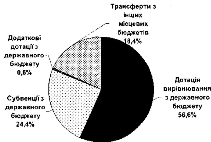
Рис. 2. Структура міжбюджетних трансфертів, що надійшли до місцевих бюджетів Тернопільської області у 2010 р.*

Вітчизняна система оподаткування є однією з найбільш складних і найменш ефективних не тільки серед країн Європи, а й у глобальному порівнянні, що регулярно підтверджують міжнародні звіти та рейтинги, дослідження вітчизняних економістів, а також оцінки інвесторів, що працюють в Україні. У рейтингу податкових систем Paying Taxes 2010, підготовленому Світовим банком спільно з PriceWaterhouseCoopers, Україна посіла 181 місце зі 183 досліджуваних країн. За даними дослідження, середньостатистичне українське підприємство протягом року сплачує 147 податків та платежів, що є найгіршим показником у світі (183 місце). Для порівняння, в Росії