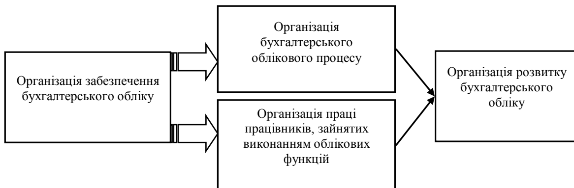
Рис. 2. Алгоритм формуючих складових механізму організації бухгалтерського обліку

Алгоритм організаційних заходів щодо організації облікового процесу можна представити у наступному вигляді (рис. 2).