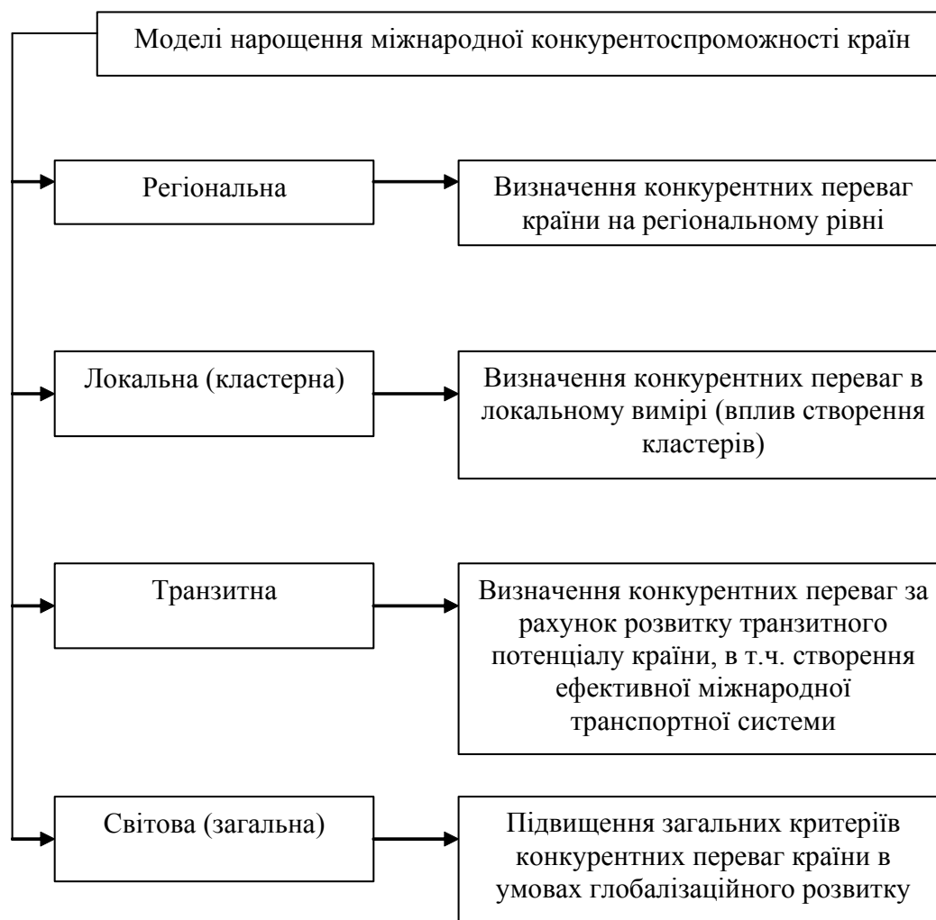
Рис. 2. Моделі нарощення міжнародної конкурентоспроможності країн

У звіті про глобальну конкурентоспроможність, опублікованому міжнародною неурядовою організацією, Всесвітній Економічний Форум (Швейцарія), за індексом конкурентоспроможності у 2009 – 2010 рр. Україна зайняла 82 місце серед 133 країн з результатом 3,95 бали. У порівнянні з рейтингом 2008 – 2009 рр. наша держава втратила 10 позицій (72 місце). Світовим лідером за конкурентоспроможністю у 2009 – 2010 рр. стала Швейцарія з результатом 5,6 бали. Друге місце за США (5,59), третє за Сінгапуром (5,55).