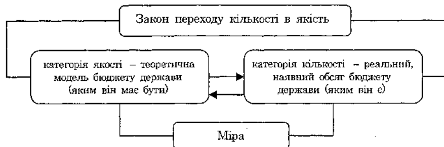
Рис. 1. Співвідношення між кількісними та якісними характеристиками бюджету держави

На нашу думку, філософська категорія якості стосовно бюджету відображає такий обсяг централізованого фонду грошових коштів держави, який за наявного ВВП задовольнив би інтереси суспільства (держави, юридичних і фізичних осіб), а категорія кількості – обсяг фактичного, наявного централізованого фонду. Співвідношення між цими категоріями схематично зображено на рис. 1.